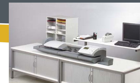
Poste de travail composé de 2 comptoirs fermés pour une ergonomie optimale (L 3 m) Équipement (L 1,66 m)