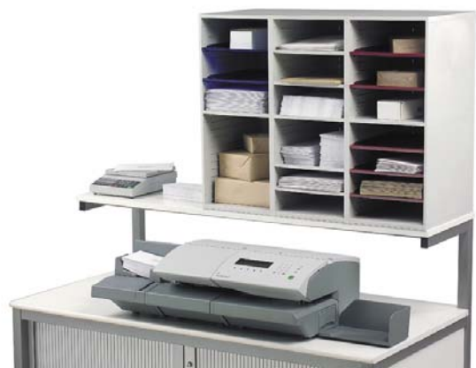
Poste de travail avec rehausse pour positionner la balance (L 1,50 m) Équipement avec alimenteur standard (L 0,87 m)

Pour en savoir plus, connectez-vous sur www.satas.fr