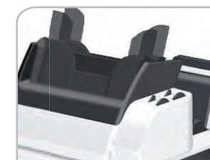
2 alimenteurs de documents + 1 alimenteur d'encart