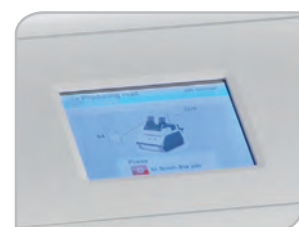
Écran tactile couleur et conversationnel